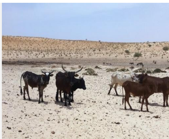
Photo 1. Exemple d'élevage bovin dans la région de Kanem (présent travail)

A l'heure actuelle l'élevage est la principale activité de la population du Kanem. Autrefois, réputée pour ses immenses potentialités agricoles à cause de sa proximité avec la région du Lac-Tchad, les activités d'élevage ont pris un coup sérieux avec les sécheresses répétitives qui ont entraîné la disparition des ressources pastorales dans la région du Kanem. Toutefois, l'élevage des petits ruminants permet aux ménages vulnérables de trouver sur le marché les céréales pour leur alimentation. Au sens strict, un seul système d'élevage existe au Kanem. Il s'agit du système agropastoral à dominance pastorale qui caractérise l'ensemble de la région. Le système pastoral nomade ou transhumant est mené par les éleveurs peuls ou arabes qui ne sont pas originaires de cette région. Dans le système agropastoral à dominance pastorale, l'alimentation du bétail est basée exclusivement sur l'exploitation des pâturages naturels (Photos 1 et 2) et la complémentation qui se fait à base de sous-produits agro-industriels. Ce type d'élevage se caractérise par une petite transhumance en début de saison sèche pour l'exploitation des pâturages et une grande transhumance à partir de janvier qui conduit les troupeaux en direction des zones sud à la recherche de pâturage et d'eau et ce jusqu'au retour de la saison pluvieuse.