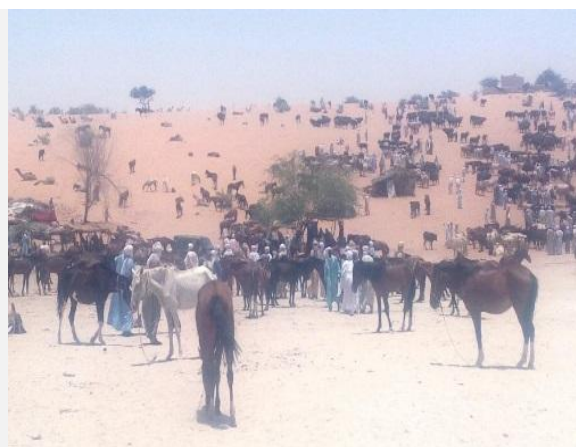
Photo 2. Exemple d'élevages mixtes dans la région de Kanem (présent travail)